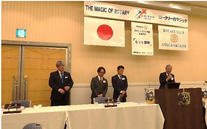
尼崎南ロータリークラブ