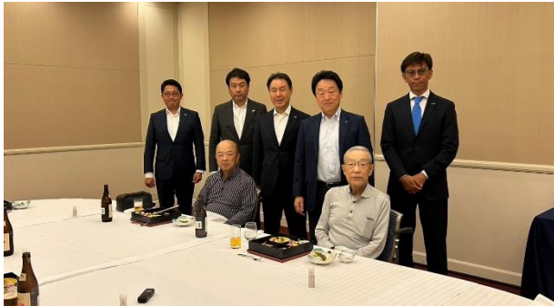
2024. 05. 22 ホテルヴィスキ尼崎 長期計画会議・懇親会