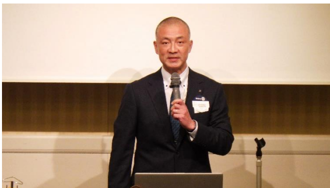
尼崎市教育委員会学校教育課 澤田ケイタ 様