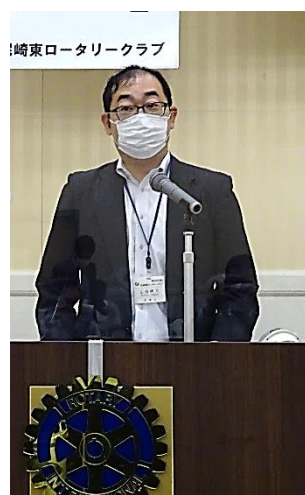
② 会計監査報告 山田暁久 会計監査