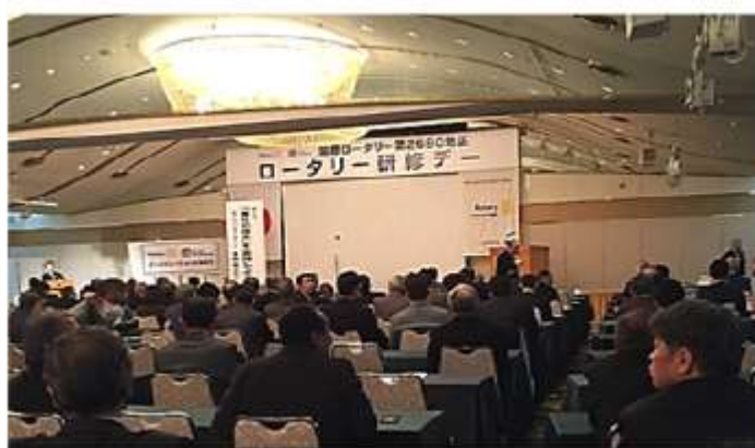
「奉仕の理想を实践しよう」 会場履歴 2018/12/02 加古川プラザホテル

参加するロータリアンにとっても、従来は2日か3日に分けて参加していたのが1日で受講できただけに、一日集中は疲れましたが、時間の節約など結構有意義な1日ではなかったかと思えます。