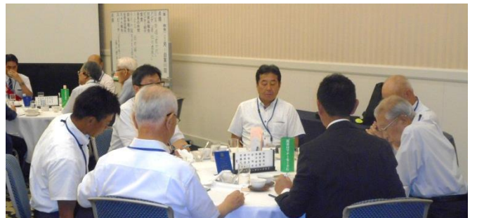
テーブルディスカッション