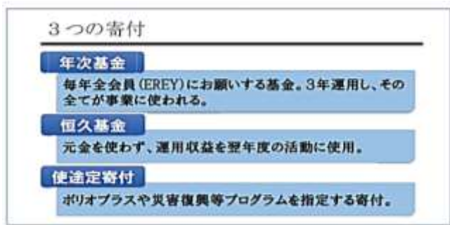
ロータリー財団ハンドブック(第5訂版)第2620地区資料

それぞれの奉仕事業への使われ方を図で説明いたしますと、年次基金は先述通り3年間の投資後DDFとWFに各50%に分配され、WFの用途は概ね6つの重点活動プロジェクトに充当されます。