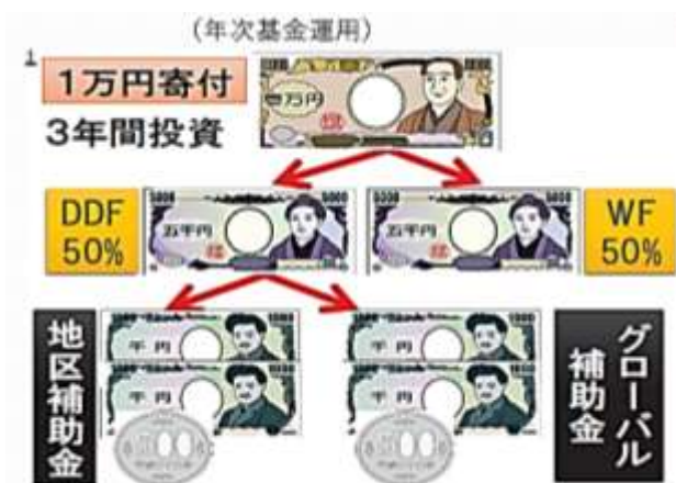
ロータリー財団ハンドブック(第5訂版)第2620地区資料

一方DDFは、基本的には全額地区補助金に充当されますが、事業の内容によってグローバル補助金に相当する場合は、下図のように分配されることもあります。