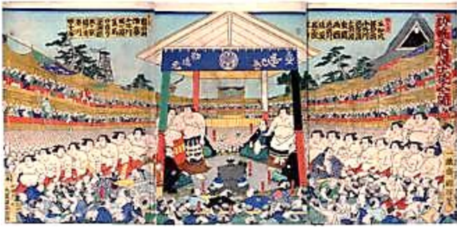
歌川国輝(二代)画「勸進大相撲土俵入之図」