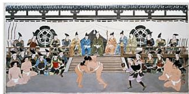
織田信長の上覧相撲

日本書紀によると、第11代垂仁天皇の時代、大和の国に「當麻蹶速(たいまのけはや)」という猛者がいて、出雲の国で怪力男と聞こえた「野見宿禰(のみのすくね)」と奈良の地で相撲を取った(決闘)とされています。今でいう天覧相撲ですが、長い闘いの末、當麻蹶速は蹴り殺されたとあります。これが日本相撲の始まりで、奈良が相撲発祥の地と言われている所以です。その後、相撲はその年の農作物の収穫を占う祭りの儀式として毎年行われ、これが後に宮廷の行事となり300年続いたそうです。